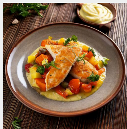
März: Gebratene Rotbarbe mit Bouillabaisse-Gemüse und Topinamburcrème

Der Zollpackhof ehrt ab sofort monatlich eine*n Mitarbeiter*in des Monats, ausgewählt von den Abteilungsleitenden für besonderes Engagement und Teamgeist. Die Auszeichnung umfasst eine Prämie, eine exklusive Anstecknadel und ein in Gold gerahmtes Porträt. Die erste Ehrung erfolgt im März – wer gewinnt, bleibt bis zur feierlichen Bekanntgabe geheim.