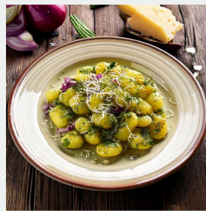
April: Gnocchi mit Bärlauch-Pesto, roten Zwiebeln und Bergkäse